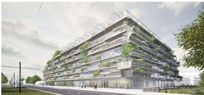
Climax – Architectes TETRARC avec LAMOTTE