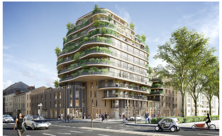
Arborescence – Architectes WY-TO et CRESPIY-AUMONT, avec Vinci Immobilier

Arborescence est l'expression architecturale d'un site exceptionnel reliant la nature à la ville, la Maine au centre-ville. Inscrite dans l'ADN végétal de la ville d'Angers, cette nouvelle résidence en bords de Maine est un tribut au patrimoine angevin réinterprété à l'échelle d'un mode de vie contemporain.